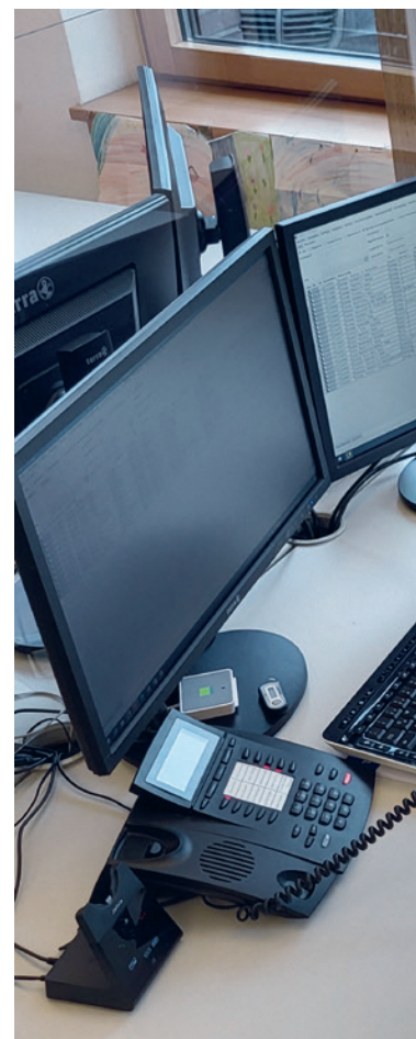
Abb. 3: Papierlos und standortunabhängig: Die Software KuRD (Kabel- und Rohrleitungsbau Digital) ist eine für den Alltag des Kabel- und Rohrnetzbaus und hier speziell für den datenintensiven Hausanschlussprozess entwickelte, Windows-basierte Softwarelösung.