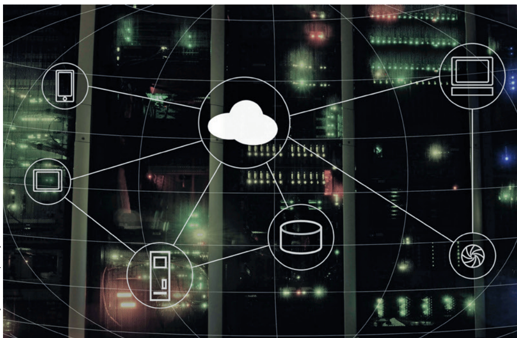
Abb. 2: Über eine cloud-basierte Datenaustauschplattform können auch Auftraggeber und Auftragnehmer alle für eine Baumaßnahme relevanten Dokumente austauschen.