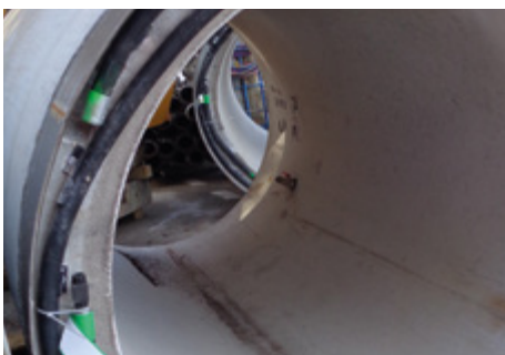
Einbaubereites Vortriebsrohr mit hydraulischer Fuge (Bild oben), Nahaufnahme (Bild unten).